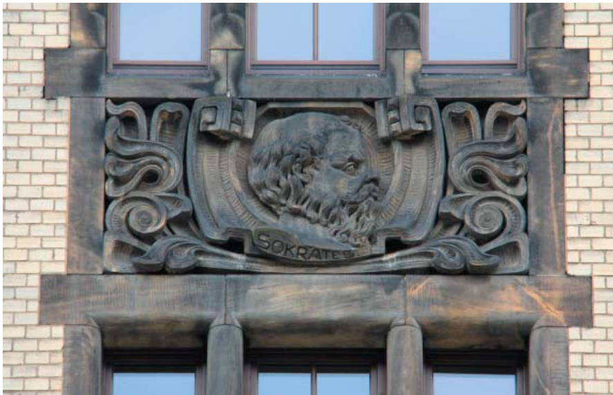
2. Dekoracja prezentująca program nauczania: portret Sokratesa. Fot. Agnieszka Gryglewska, 2011

(regulator obrotów Jamesa Watta na kole zębatym), geografii (globus), rysunku (cyrkiel z ekierką i głowicą jońską) 87 . Z muzyką i zajęciami teatralnymi związane są wyrzeźbione na poziomie auli na wschodnim szczycie stylizowane na antyczne liry o zgeometryzowanej formie oraz maski teatralne starca i młodzieńca. Profil Sokratesa na zachodniej elewacji może wyrażać idee i metody nauczania w gimnazjum niemieckim, dla którego charakterystyczny był duch naukowej dociekliwości (il. 2).