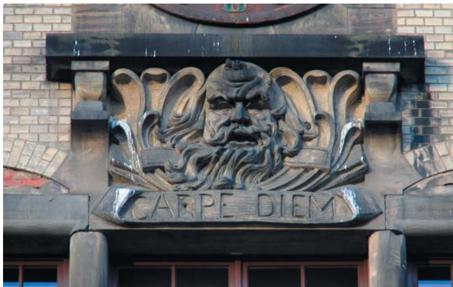
3. Sentencja na wschodniej elewacji. Fot. Agnieszka Gryglewska, 2014

num puto”, „Edel sei der Mensch, hilfreich und gut” 88 , nigdy nie zostały wyrzeźbione na delikatnych wstęgach na kapitelach kamiennych kolumn w holu na parterze.