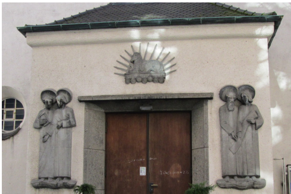
Il. 3. Kościół katolicki pw. Serca Jezusowego (Herz Jesu) w Ratyżbonie

„Voskové květy středověku” – tak Tomáš Krejčík, czeski historyk i sfragistyk, określił pieczęcie średniowieczne 34 . Użyta przezeń metafora stanowi coś więcej niż tylko obrazowe określenie. Wydaje się, że jest to sposób spojrzenia na pieczęć jako na istotny element estetyczny dokumentu. W średniowieczu i czasach nowożytnych ważne było poczucie piękna, co oznacza zainteresowanie estetyką przedmiotu. Brak tego aspektu powodował zanik zainteresowania pięknem, a więc i utratę jego wagi, aktualności 35 . A pieczęć, choć sporo sygillów nie można uznać za efektowne, często cechowało swoiste piękno, co czyni z niej znakomite źródło do badania potrzeb estetycznych człowieka w ogóle, jednak zwłaszcza właścicieli pieczęci oraz rytowników tłoków, a w konsekwencji także ich odbiorców. Nie sposób nie zauważyć, że najbardziej powszechną formę pieczęci stanowi okrąg (koło). Genezy tej formy należy doszukiwać się w jej pełni i doskonałości 36 . I czy w takim kształcie pieczęć może nam powiedzieć coś o swojej funkcji, semantyce i przekazie?