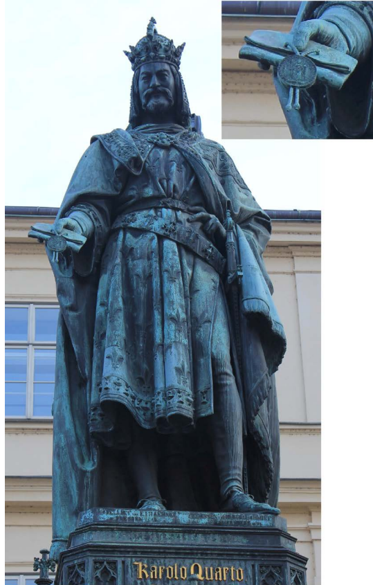
Il. 4. Pomnik Karola IV Luksemburskiego, Praga, Křižovnické nám.

mocy substancjalnej. Badając pieczęć, powinniśmy wychodzić z założenia „energetycznej inwersji znaczeń”, tj. posiadania (przypisania) różnych znaczeń jednemu i temu samemu obrazowi 46 , swego rodzaju fallibilizmu 47 . I to jest, wydaje się, jednym z największych współcześnie wyzwań. Nauka wymaga precyzyjności, klarowności w argumentacji i wnioskach. W przypadku pracy ze źródłami ikonograficznymi nie zawsze jest to możliwe, gdyż sama natura obiektu badania często może mieć kilka warstw interpretacyjnych.