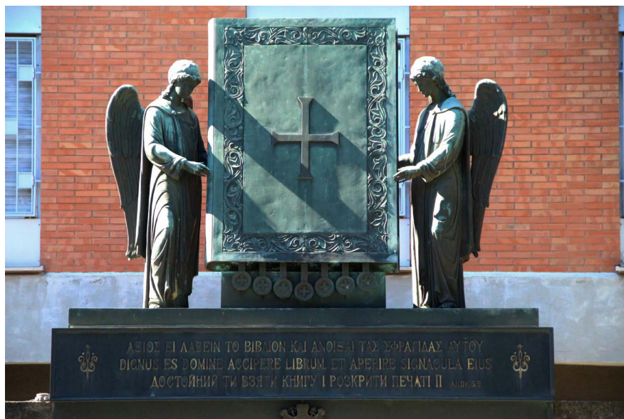
Il. 2. Pomnik przed budynkiem Ukraińskiego Uniwersytetu Katolickiego im. św. Klemensa (obecnie Instytut św. Klemensa) w Rzymie

Już mniej kojarzy się pieczęć z dziełem sztuki i zdecydowanie rzadko można się spotkać z badaniem pieczęci jako źródłem do analizy mentalności, struktur longue durée , problemów filologicznych, teologicznych, jako kodu kulturowego, komunikacyjnego, narzędzia odzwierciedlenia struktur społecznych, inspiracji politycznych, religijnych, statusu osoby, skrzyżowania kultur, tożsamości indywidualnej i zbiorowej, historii gospodarczej, społecznej. I to właśnie na tych zagadnieniach chciałbym się nieco skoncentrować.