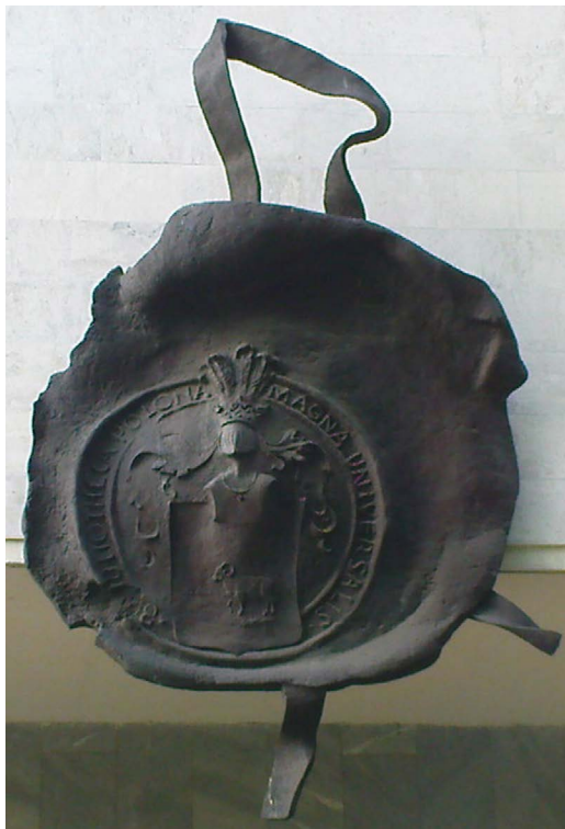
Il.1. Budynek Biblioteki Narodowej w Warszawie

który założył bibliotekę z zakresu historii sztuki, gromadząc ją przez całe niezbyt długie życie. Do dziś jest ona jednym z najważniejszych księgozbiorów z tej dziedziny na świecie.